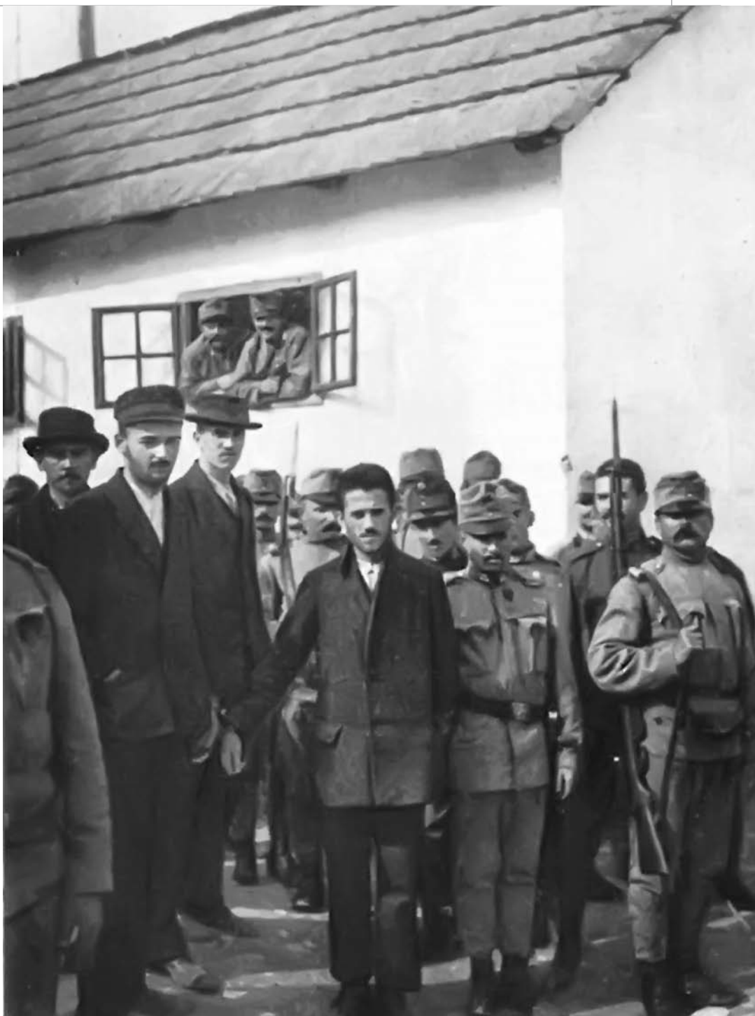
Гаврила Принцип иа одводе на суђење

Гаврило Принцип био је по мом тумачењу пре једна балканска верзија Нелсона Манделе, борац против последње колонијалне управе на европском тлу – аустроугарске управе над Босном и Херцеговином, која је заиста била у положају класичне колоније. Међутим, биће потребно још много истраживачког труда да се неке од већ укоренењених представа о Сарајевском атентату, Принципу и Апису бар релативизују, али ће бити тешко да се таква тумачења трајно обеснаже додатним